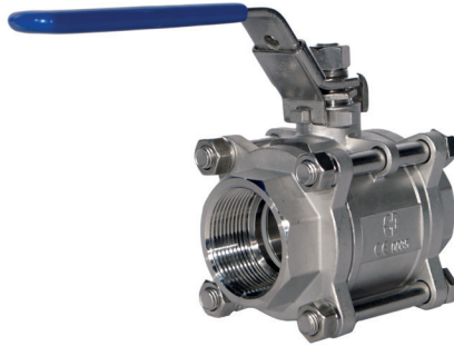
Täysaukko 3-osainen palloventtiili