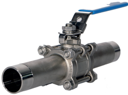
Täysaukko 3-osainen palloventtiili PH/PH