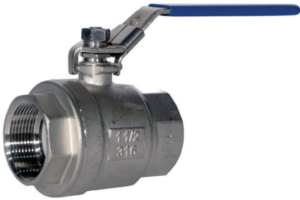
Täysaukko 2-osainen palloventtiili