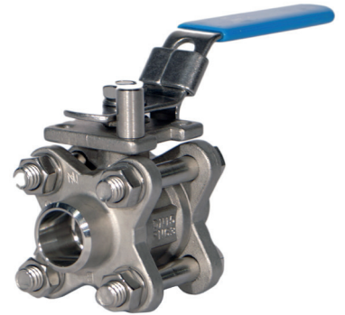
Täysaukko 3-osainen palloventtiili H/H